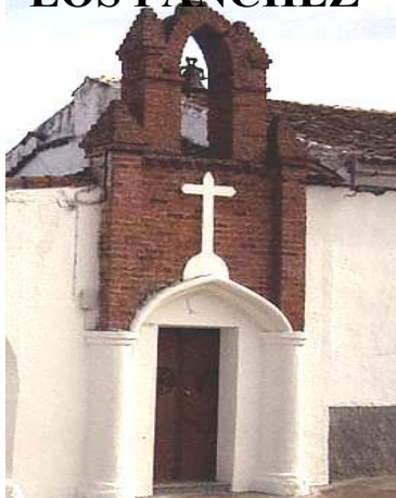
Iglesia de Los Pánchez.

TODOS LOS ACTOS RELIGIOSOS SE CELEBRARÁN EN LA IGLESIA.