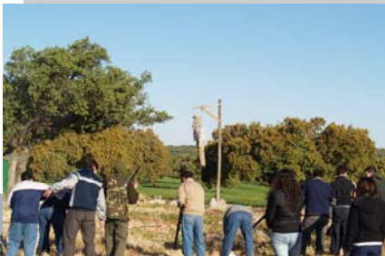
Judas de O. Altos.

En la aldea de Ojuelos Altos , el domingo de Resurrección, a las 9'00 h., en el parque, se mata al Judas a tiros de escopeta y se quema.