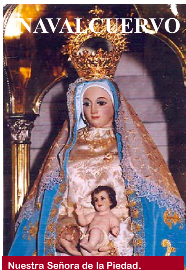
Nuestra Señora de la Piedad.

TODOS LOS ACTOS RELIGIOSOS SE CELEBRARÁN EN LA IGLESIA.