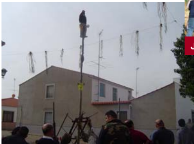
Judas de Cuenca.

En la aldea de Cuenca , el domingo, en la procesión del Resucitado, en el encuentro en “La tronca”, sobre las 11'00 h. se mata al Judas a tiros de escopeta y se quema.